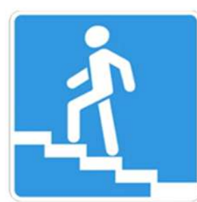
Надземный пешеходный переход